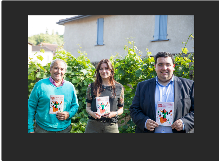
Offre culturelle gratuite CCBA Nogaro : spectacles vivants, patrimoine et gastronomie

4 sorties « Échappées curieuses » avec marchés de producteurs en Bas-Armagnac