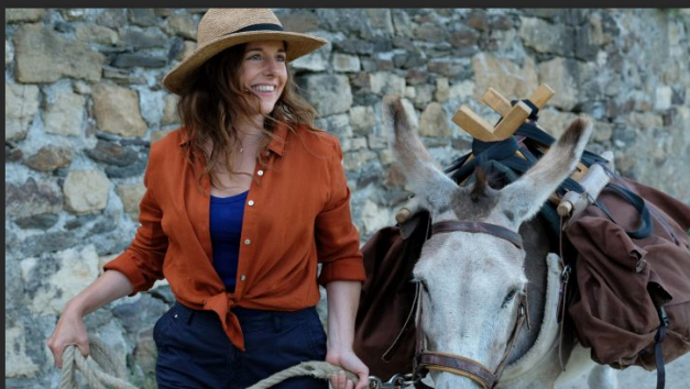
"Antoinette dans les Cévennes"

Au terrain de foot (en cas de pluie, à la salle des fêtes), une séance de cinéma à la belle étoile.