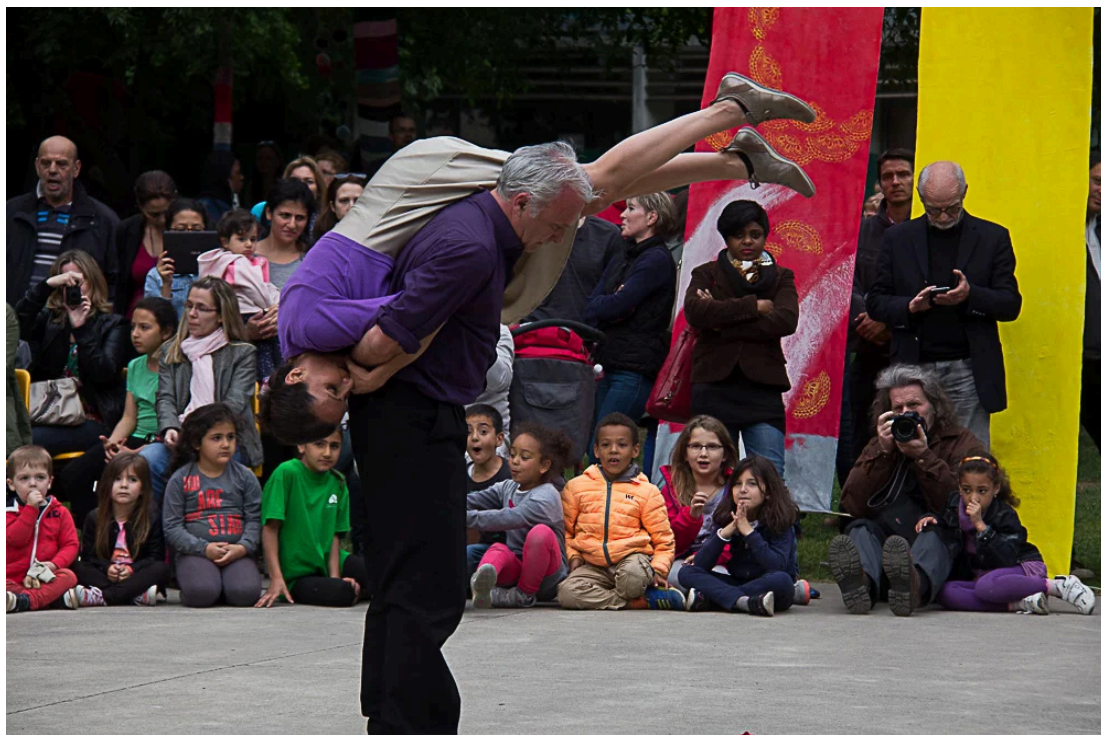
Spectacle "Verbena"

Jeudi 29 juillet à Monguilhem : spectacle interactif « Verbena » (musique et danse)