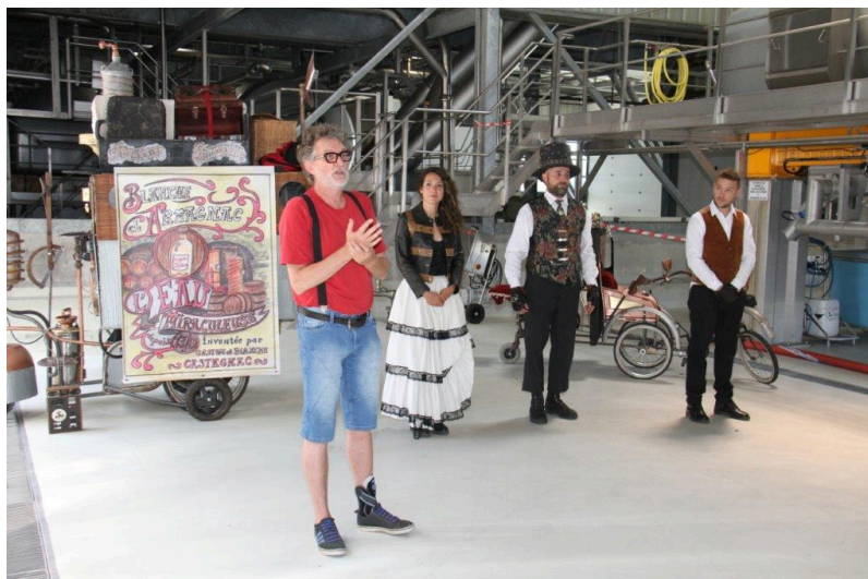
Une seule question s'impose à la fin de ce spectacle : pour ceux qui n'étaient pas dans la salle, ce samedi 26 juin, quand et où une nouvelle représentation du Castagnac Théâtre ?