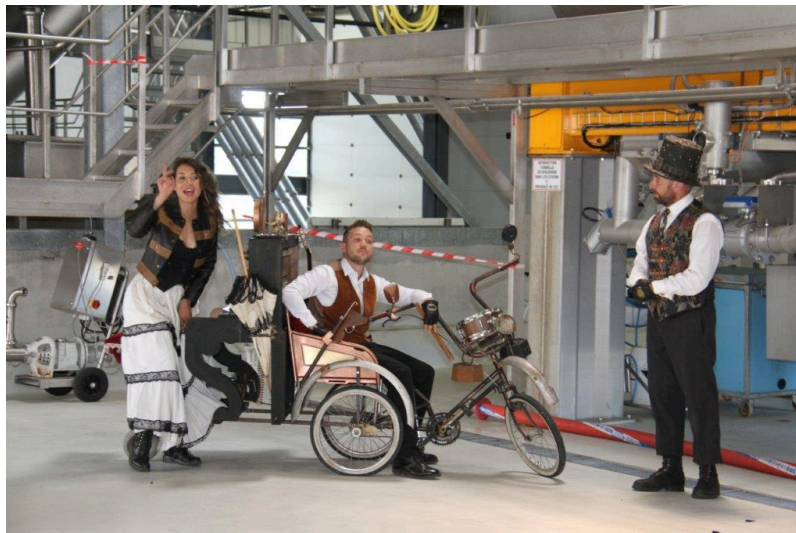
Un public enthousiaste et de suite conquis, enfants comme parents.