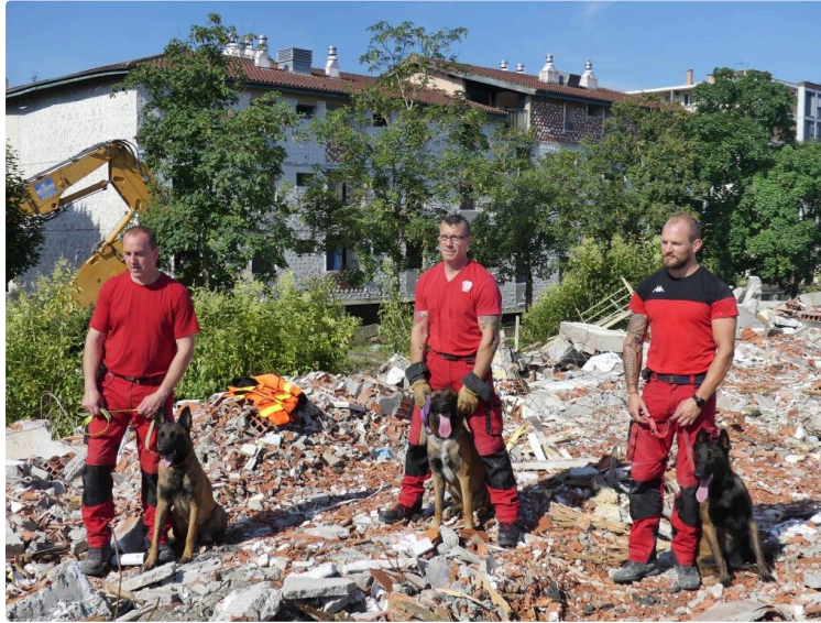
Ils se font les dents dans les décombres d'un quartier du Garros

Ce sont les trois chiens de l'équipe cynotechnique qui se sont entraînés avec leurs maîtres-chiens dans la recherche de personnes prisonnières dans des décombres