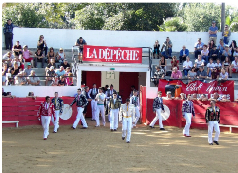
l'entrée de la Couse Landaise et la "Cazérienne"