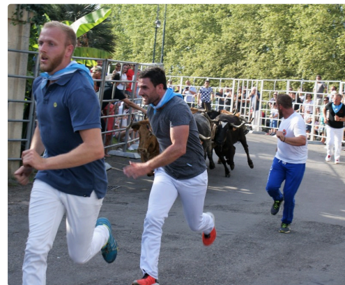
le grand "Encierro" pour les grands