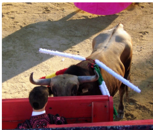
" Ton œil noir me regarde"