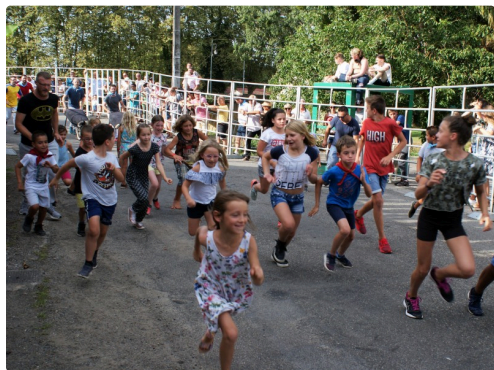
le petit "encierro" pour les enfants

Bien entendu ces festivités auront lieu dans le respect des conditions sanitaires en vigueur.