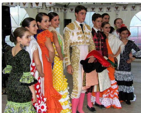
Fiesta y Alegria aux fêtes plaisantines