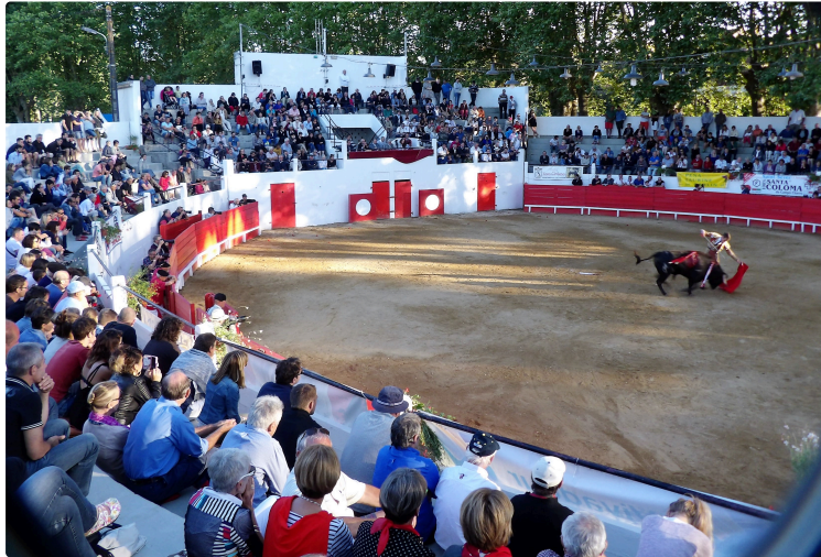
les grandes fetes du pays a Plaisance du Gers

du 9 au 14 juillet un vaste et alléchant programme pour tous