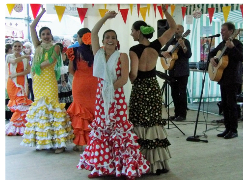
Danses et Chansons avec "Paco y Paco"