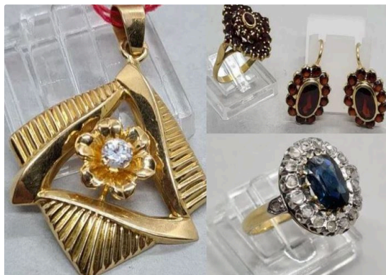
Des bijoux à profusion !

Une vente qui leur est entièrement dédiée