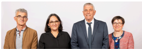
Les élus et leurs suppléants

" Dimanche, au premier tour des élections départementales, notre équipe est arrivée en tête dans 37 des 43 communes que compte le canton Pardiac Rivière Basse, avec 56,77% des suffrages exprimés. Ce résultat témoigne de la confiance que les électrices et les électeurs placent en notre capacité à nous mobiliser pour eux et nous permet de poursuivre notre engagement à leur service. Nous les en remercions vivement et très sincèrement.