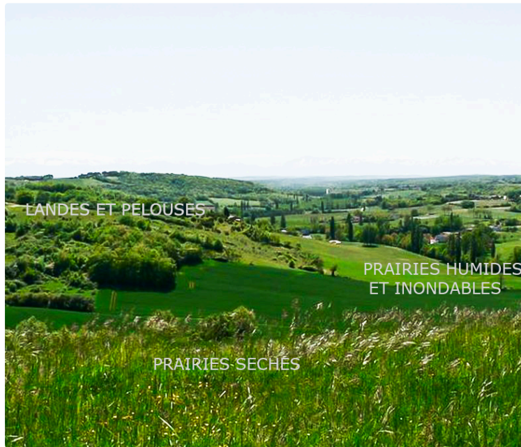
Restaurer les herbages avec Life Coteaux gascons (réunion à Saint-Pierre-d'Aubézies)

Un périmètre de prairies préservées avec l'Adasea 32