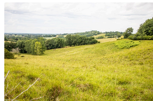
Prairie de la région Castelnavet - Saint-Pierre-d'Aubézies