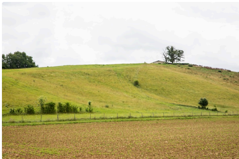
Prairie de la région Castelnavet - Saint-Pierre-d'Aubézies