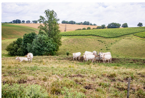
Prairie de la région Castelnavet - Saint-Pierre-d'Aubézies