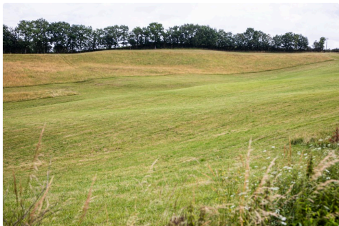
Prairie de la région Castelnavet - Saint-Pierre-d'Aubézies