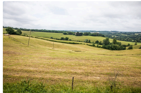
Prairie de la région Castelnavet - Saint-Pierre-d'Aubézies