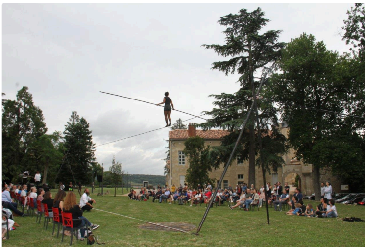
Les Côtes de Gascogne s'envolent pour tout l'été

Avec la première édition d'un événement œnotouristique