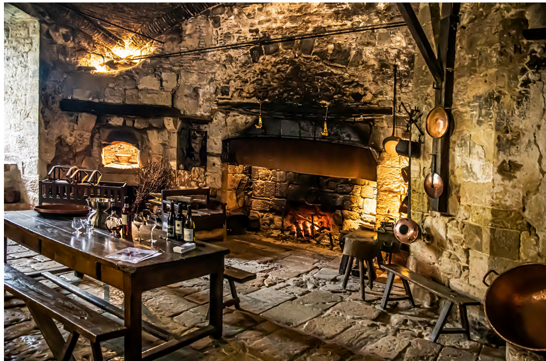
La cuisine du château de Cassaigne