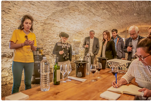
Dégustation dans la cave du monastère de Saint-Mont