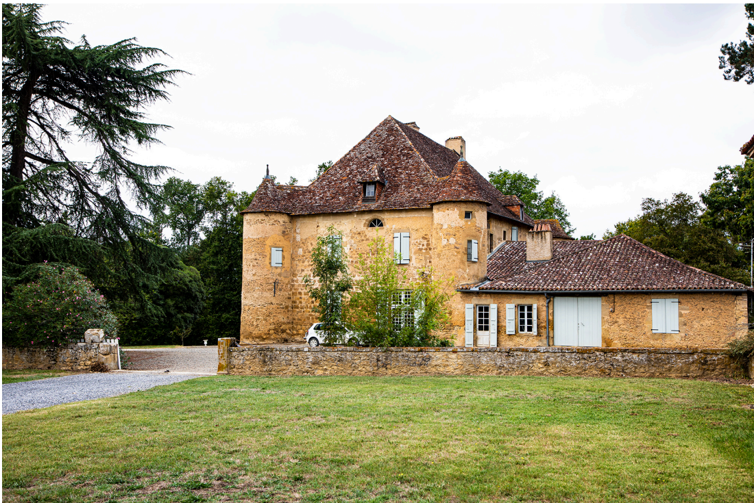
Le château de Sabazan

Or qu'y a-t-il de mieux qu'un bon vin, dans un superbe environnement naturel et convivial, pour ragaillardir et remonter le moral de nos concitoyens brimés par les contraintes sanitaires ? On se met donc « en quatre » pour satisfaire de façon parfaite les attentes des visiteurs (tout en buvant et en faisant boire avec modération, comme il se doit). Et cela s'exprime par l'organisation de séjours en immersion dans un environnement viticole authentique et accueillant.