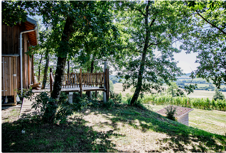
La démarche « accueil vigneron » de Plaimont à Saint-Mont, Plaisance et Aignan

Pour une expérience authentique de joie de vivre dans l'œnotourisme