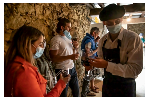
Dégustation dans le chai du château de Sabazan