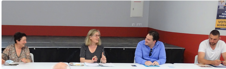
Ils font campagne à la campagne.