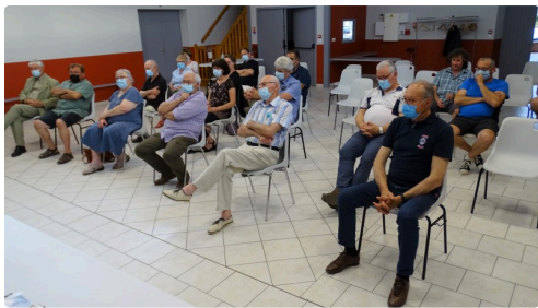
Sur la vingtaine de personnes autorisées sont essentiellement présents les élus locaux et les très proches.

L'équipe annonce qu'elle n'aura pas peur de parler haut et fort et de porter les dossiers au plus haut niveau qu'ils pourront. Ils revendiquent d'être des gens de la terre et pas des déterrés ni hors sol. Les générations se passent le relai jusqu'à la transformation. C'est cette transformation qu'ils proposent.