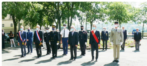
Les autorités civiles et militaires.