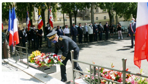
Dépôt de gerbe par le préfet du Gers, Xavier Brunetière.