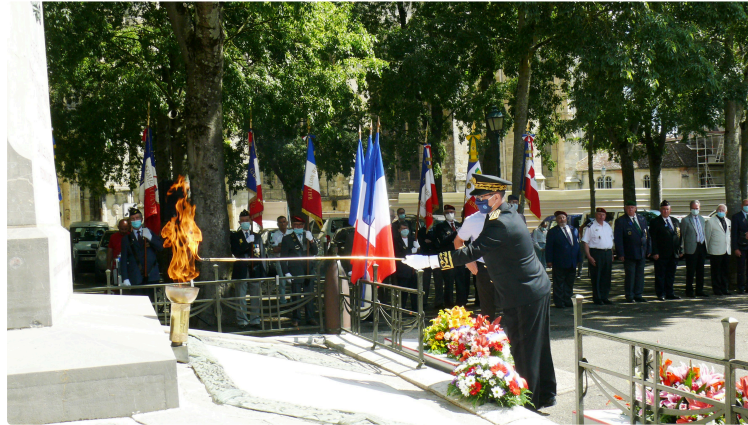
Commémoration de l'appel du 18 juin 1940

A l'occasion du 81ème anniversaire de l'appel à la résistance du Général Charles de Gaulle lancé depuis Londres le 18 juin 1940, une cérémonie s'est déroulée vendredi matin au monument aux morts d'Auch. Il s'agissait de se souvenir de l'appel lancé sur les ondes de Radio-Londres où le Général de Gaulle appelait les Français à refuser la défaite et à poursuivre le combat aux côtés de nos alliés Anglais qui résistaient vaillamment aux armées hitlériennes.