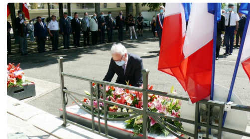
Dépôt de gerbe par le sénateur Alain Duffourg.