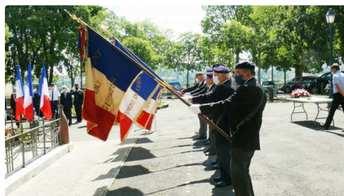
Une quinzaine de porte-drapeaux étaient présents à la cérémonie.