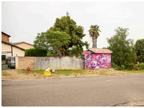
Des taches de couleur vues de la route