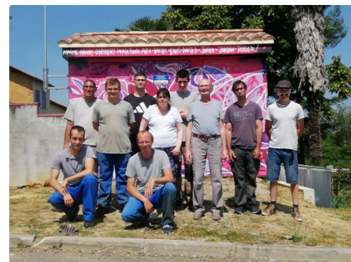
10 graffeurs sur 11