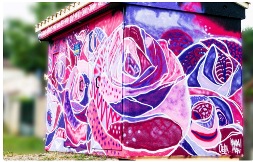
Célia et Pandaman ont signé en bas à droite