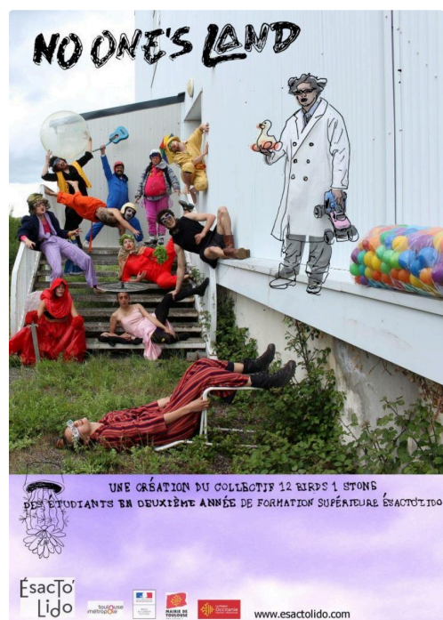
No one's land

Entre deux mondes est une pièce pour 5 danseurs acrobates et 1 chanteuse/comédienne, qui mêle le chant, la magie nouvelle, la danse verticale et la voltige. Telle une petite humanité, ce groupe se retrouve embarqué dans une épopée acrobatique et lyrique à travers le temps. Dans un monde qui bouge et les repousse, le collectif s'adapte, tente de garder l'équilibre avant que tout bascule. Une histoire de place, de liens, de gravité.