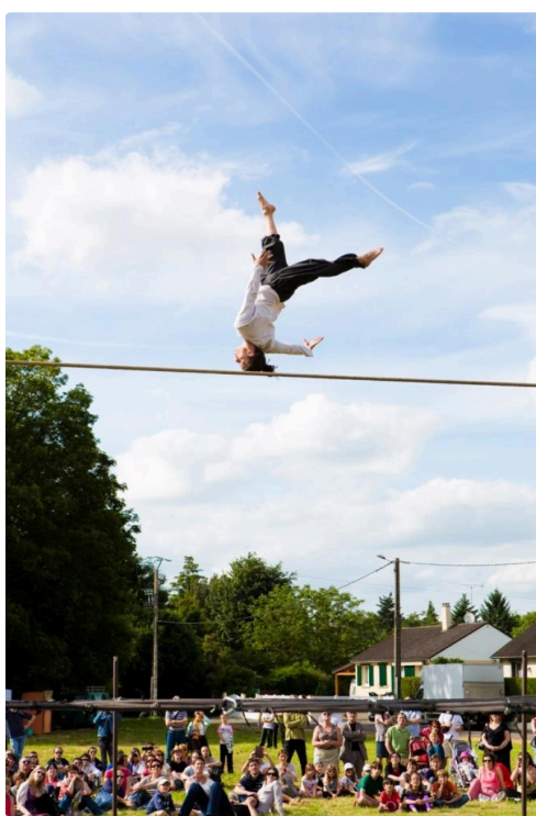
La compagnie hors surface