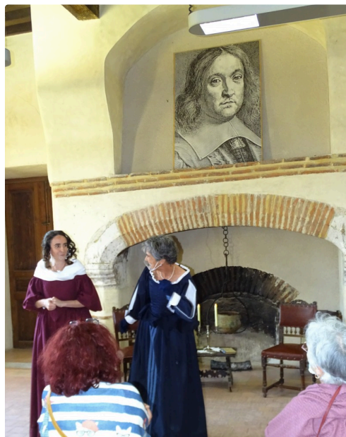
La sœur et l'épouse Fermat en pleine discussion.