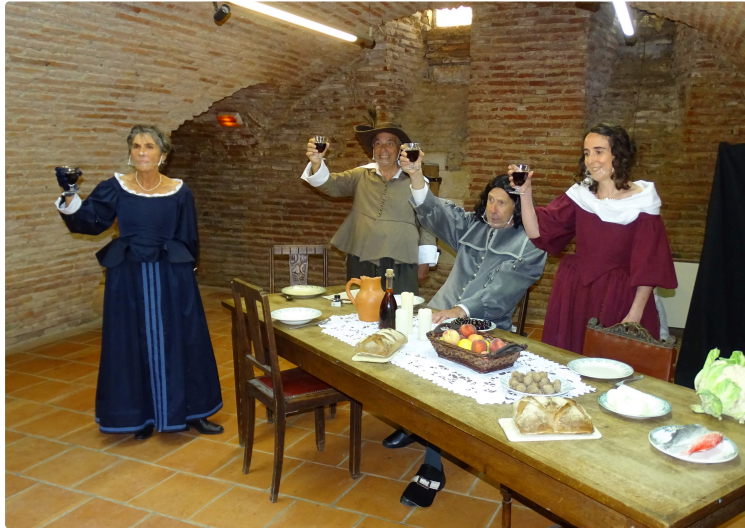
Spectacle historique en Lomagne.

Voyage dans le temps de Pierre de Fermat