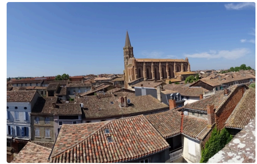
La vue du belvédère laisse comprendre l'envie d'aller plus haut.