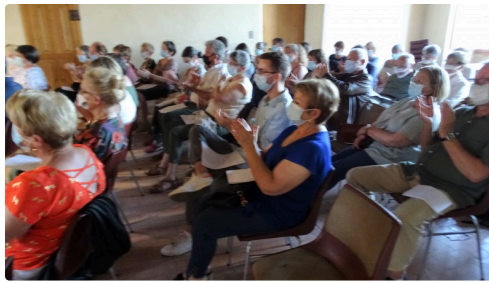
Le public a aimé.