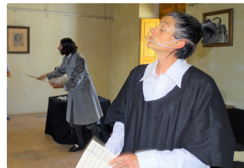
La dispute Fermat-Descartes.