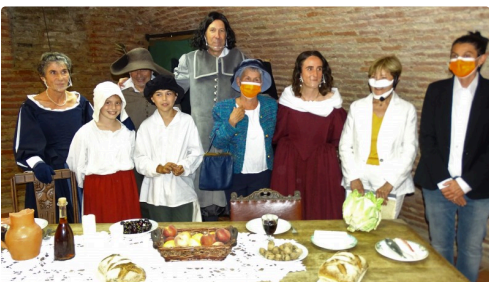
La troupe au complet avec la présidente-guide.