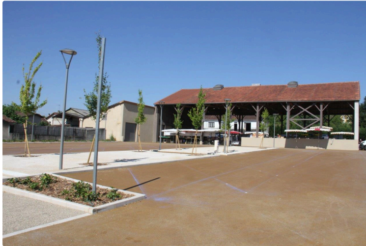
Bientôt elle sera définitivement prête, avant le démarrage des Food Trucks 2021

L'aménagement de l'esplanade Jacques Chirac est déjà bien avancé