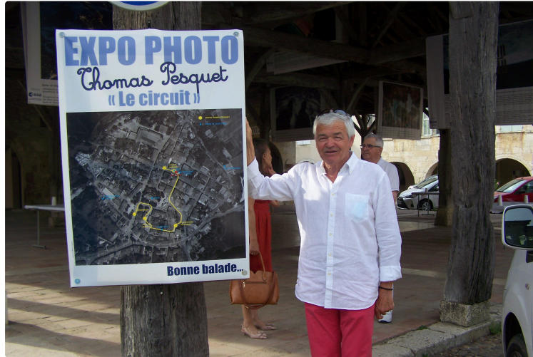
Vernissage de l'exposition de photos de Thomas Pesquet