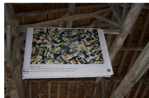
Fields in Aube ( également sous la halle )