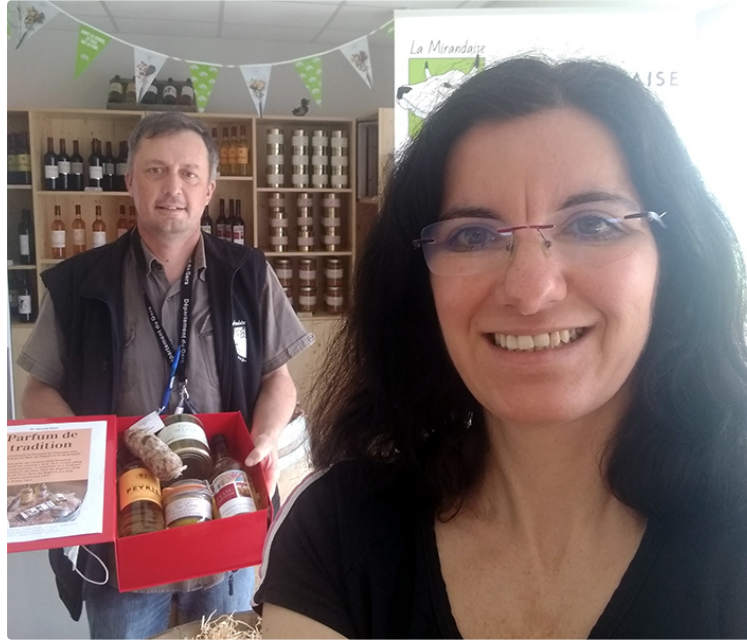
Nouvelle boutique sur l'exploitation agricole

Une vitrine sur la production locale de qualité