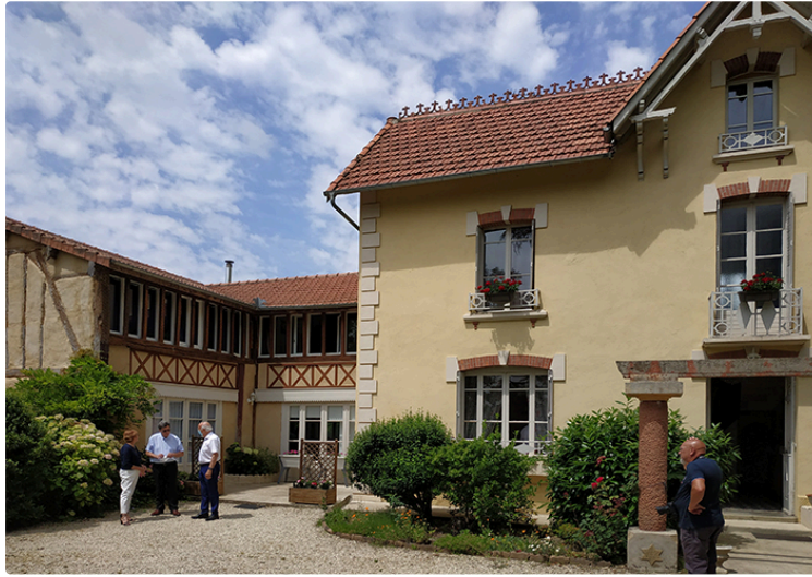
Un nouveau gîte en harmonie avec la bastide