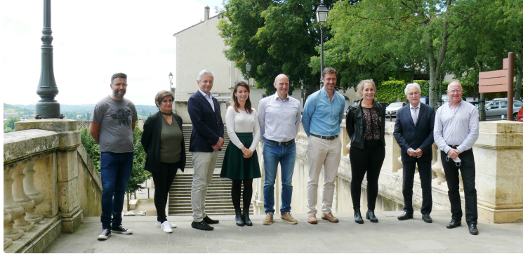
Canton Auch 1 et Auch 3 : Gers Avenir reçoit les soutiens du député Jean-René-Cazeneuve et du sénateur, Alain Duffourg