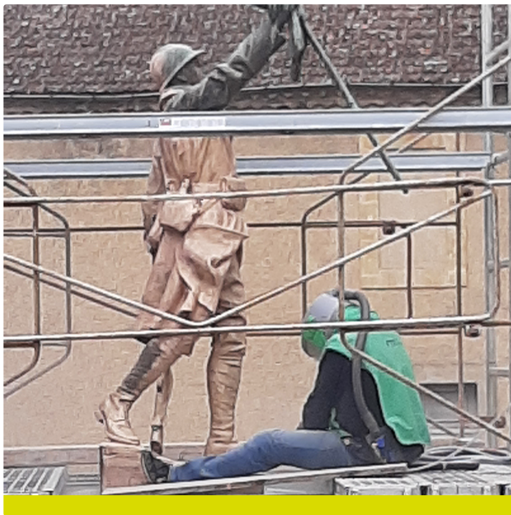
Cure de jeunesse pour le poilu