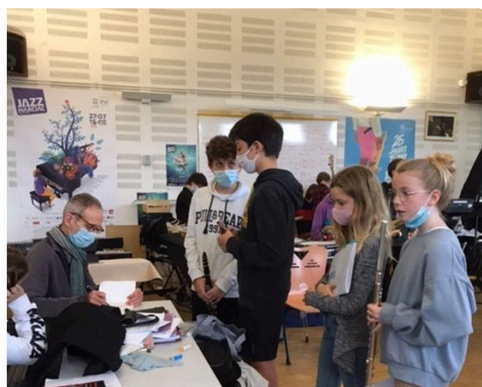
concert marciac ecole eleves 3 dedicace.JPG