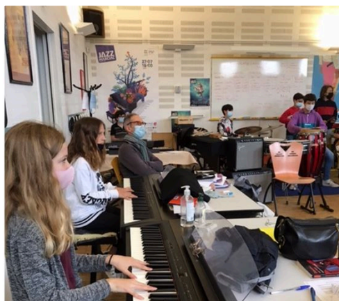
concert marciac ecole eleves.JPG