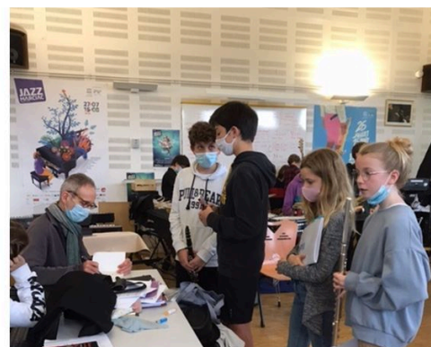
concert marciac ecole eleves 3 dedicace.JPG