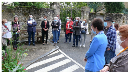
Le vernissage s'est déroulé hors de la galerie.