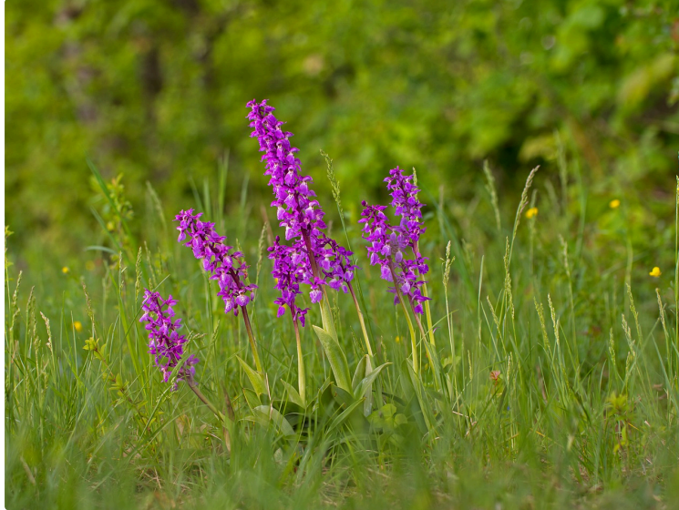
De jour comme de nuit, Lous Quarantapes

Le sentier des orchidées, puis nocturne à Monpardiac