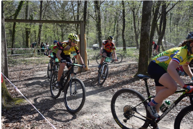
Une course qui affiche complet, les participants l'attendaient avec impatience

Promeneurs, soyez très prudent, dimanche 6 juin, si vous croisez des VTTistes en plein effort !