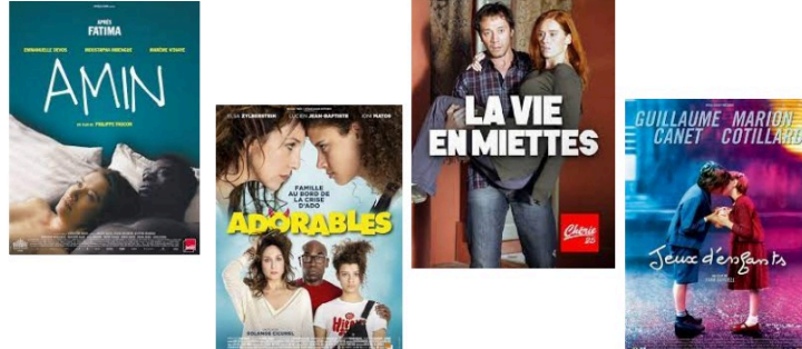
Drame, comédie, suspense ou comédie sentimentale mercredi soir...

Drame, comédie, suspense ou comédie sentimentale à vous suggérer pour votre soirée de mercredi.