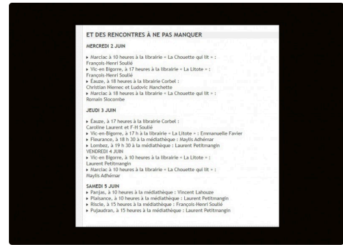
Début du programme de rencontres