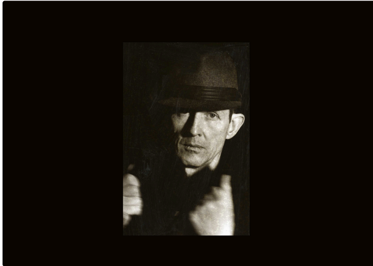
Le 4 juin : temps fort des célèbres Rencontres littéraires de Nogaro (16èmes)

Remise du Prix et ateliers-rencontres avec les écrivains