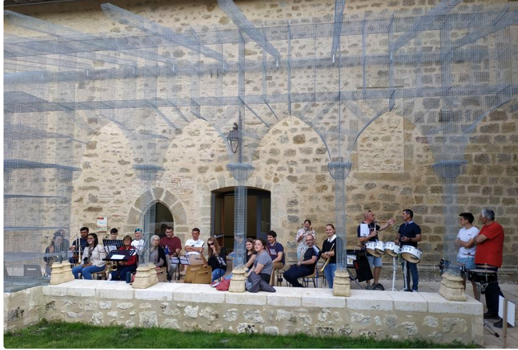
Et la banda redémarre !!