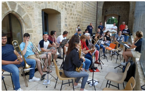
BANDA MARCIAC 6.JPG