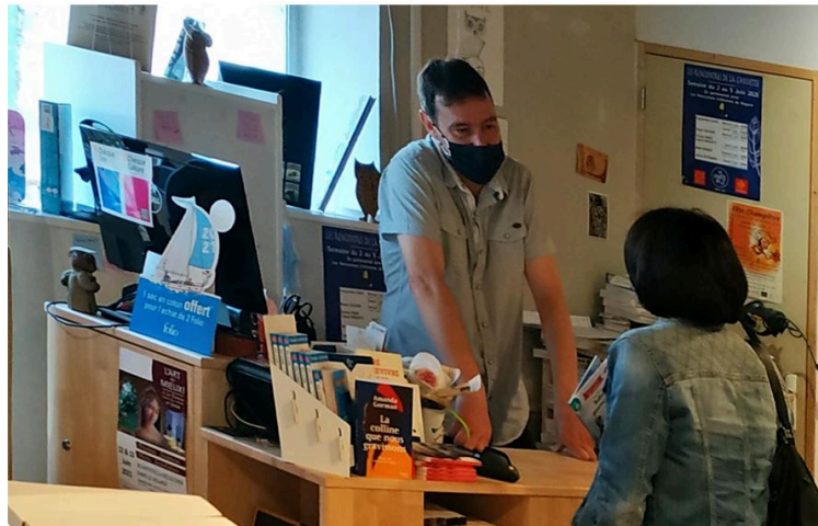
Les Rencontres Littéraires de Nogaro: c'est aussi à Marciac.