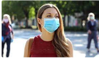
Le port du masque toujours obligatoire en extérieur dans 22 villes du département