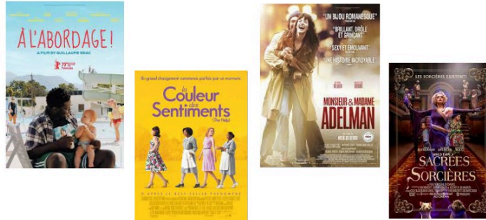
Humour, drame et fantastique vendredi soir...

Humour, fantastique, drame et fresque conjugale à vous proposer pour votre soirée de vendredi.