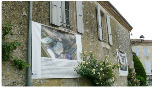
Photos surs les murs extérieurs de la médiathèque.