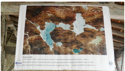
Lacs gelés du Tibet à 5 000 mètres d'altitude.