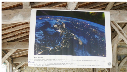
Le sud de l'Italie.