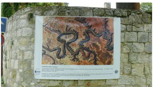
Méandres de la rivière Colorado.