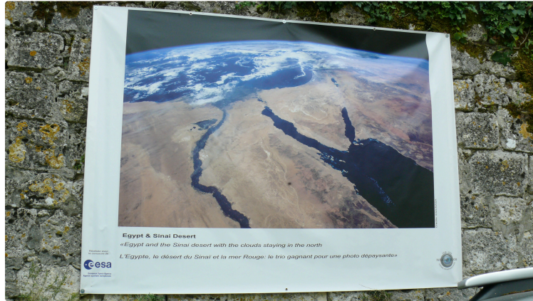
La Terre vue de l'espace par Thomas Pesquet

Les photographies sont à découvrir au gré d'une promenade dans la ville