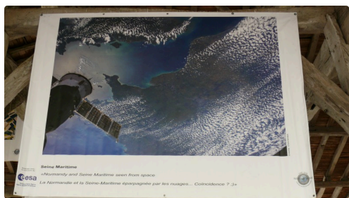
La Normandie et la Seine-Maritime.