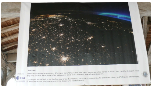
Aurores boréales, au premier plan la Pologne et derrière la Belgique.