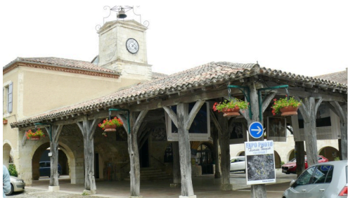
Sous la halle sont exposées de nombreuses photos de Thomas Pesquet.