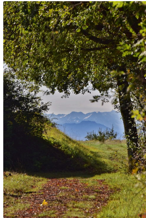
Les Pyrénées encadrées