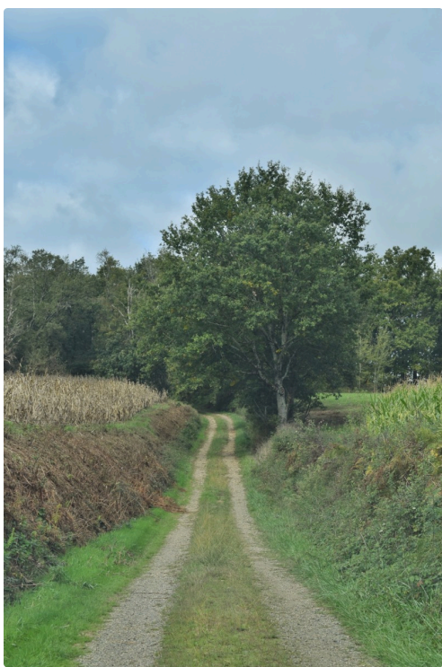
En passant par Saint Michel