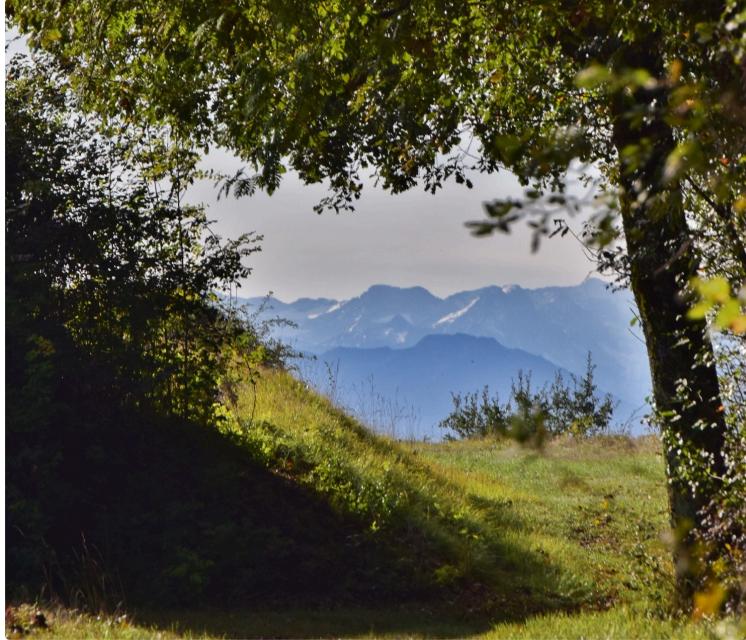
De circuits à itinéraires PR il n'y a qu'un pas

Sous l'égide de la communauté de communes Astarac Arros en Gascogne