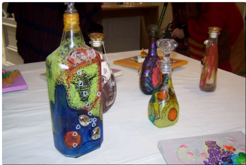
Quelques objets peints à sa façon