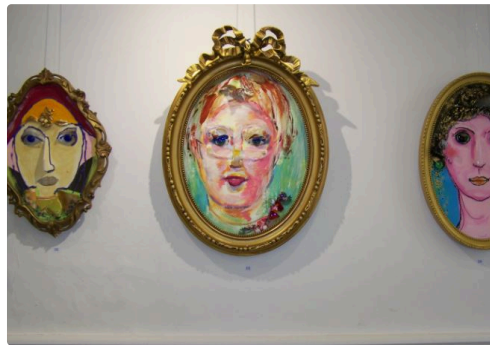
Des portraits très originaux à la galerie "Lumière de Lomagne"