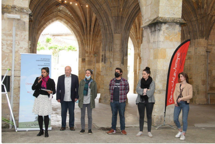
Une coïncidence bienvenue

L'ouverture de la 11e édition des Chemins d'art en Armagnac