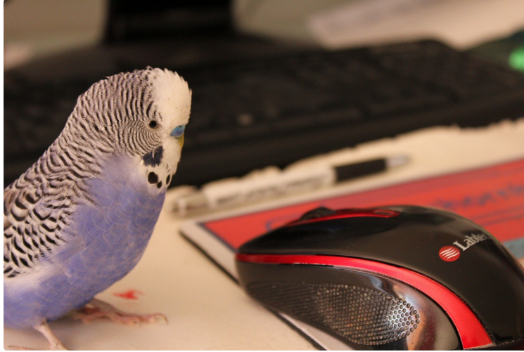
Bulletin Plume « moins 9 »