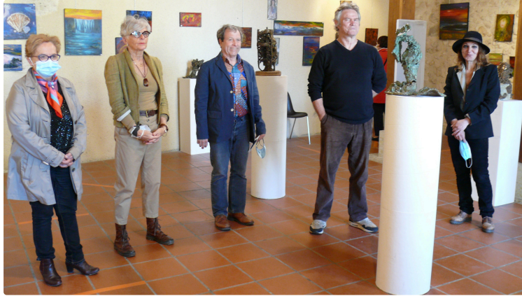
Enfin, la CAVEA ouvre ses portes

Cela faisait un an que l'espace culturel était fermé