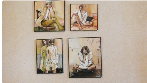
Toiles de Dominique Mian