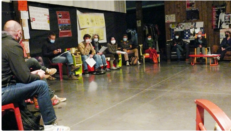
Le collectif des occupants de CIRCa et Ciné 32 veut bien faire des concessions sous des conditions

Pour l'instant le collectif note qu'il n'y a aucune avancée à ses revendications ce qui pourrait être un blocage pour la libération du Dôme