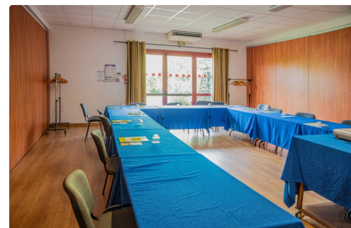
Salle destinée aux séminaires