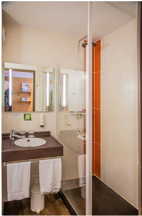
...avec sa salle de douche