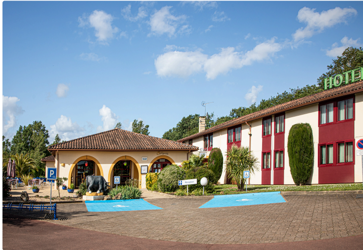
Réouverture de l'hôtel-restaurant Solenca (Nogaro)