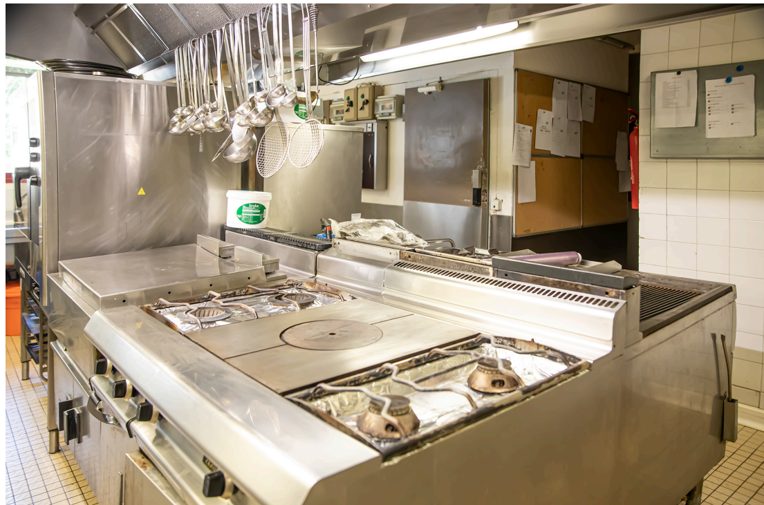
Le "piano" dans la cuisine

À partir du 19 mai 2021, les clients du restaurant peuvent prendre leurs repas sur la vaste terrasse qui est aménagée – de base – pour recevoir 70 couverts. Mais celle-ci peut en servir beaucoup plus : il y a de grands espaces. Seuls les clients de l'hôtel peuvent prendre tous leurs repas en salle – ou en terrasse s'ils préfèrent. Et l'ouverture définitive a lieu le 9 juin 2021.