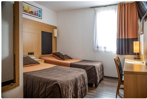
Exemple de chambre...