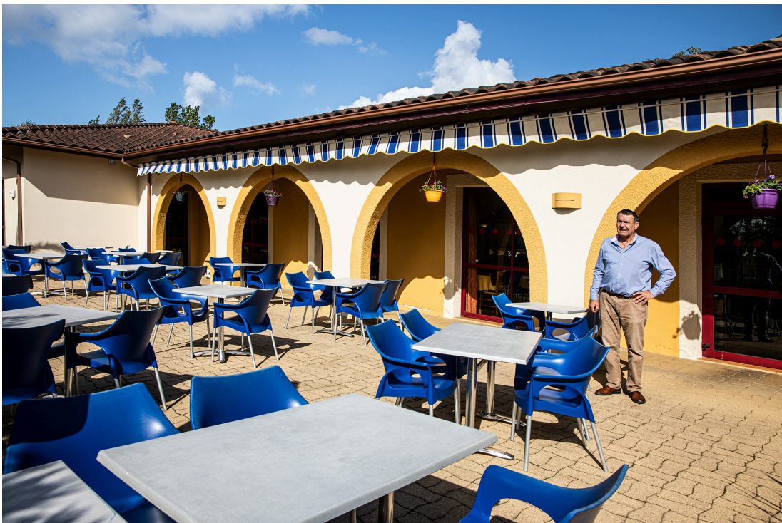
Vue de la terrasse

L'hôtel-restaurant Solenca est sans conteste une des meilleures adresses du Gers tant pour la restauration que pour l'hébergement. Et son équipe, dirigée par Gérard Ducès, le propriétaire, a utilisé le temps de la crise sanitaire (il était fermé du 19 octobre au 18 mai) pour améliorer encore plus l'accueil des clients et perfectionner la formation du personnel.