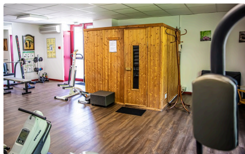
Salle de sport et sauna

(1) Label créé en 2007 par le ministère de l'Agriculture, basé sur un cahier des charges (professionnalisme et qualifications du chef, traçabilité et saisonnalité des produits). (2) L'Écolabel européen est un label fiable et officiel créé en 1992 par la Commission européenne, qui pousse au développement et à la valorisation de produits (biens et services) plus respectueux de l'environnement et de la santé. (3) Un repas de mariage vegan de 40 personnes vient d'être commandé. (4) Hotel Office for Professional Nomads.