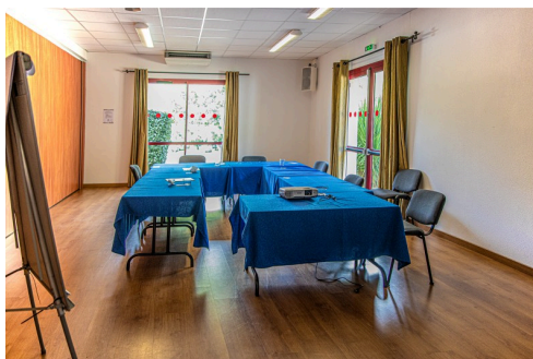
Salle de "coworking"