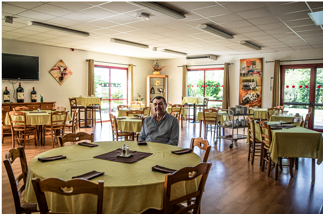
Une des salles du restaurant