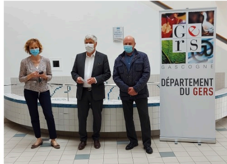
Philippe Martin lance la réouverture du centre thermal de Castéra-Verduzan dès le 7 juin 2021

Après l'abbaye de Flaran qui ouvre ses portes dès mercredi 19 mai, c'est dans les bâtiments des Thermes de Castéra Verduzan que s'est rendu Philippe Martin, président du Conseil départemental du Gers.