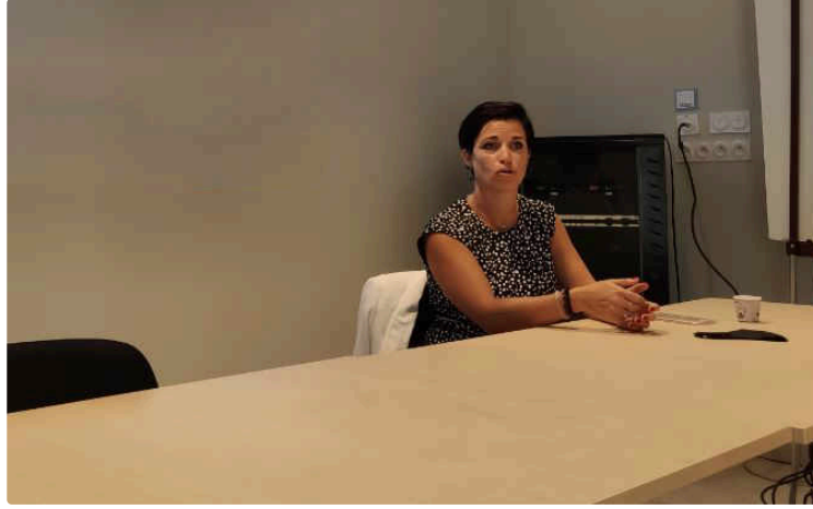
Le nouveau défi des ventes en ligne

Le GEGG propose aux entreprises gersoises une solution pour y répondre