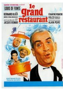
Bande annonce Le Grand Restaurant