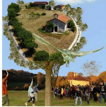
Stage "Chanter le monde en famille" à la Petite Pierre

C'est un chœur éphémère qui va s'inventer à Jégun pour créer des ponts entre les mondes, de l'occitanie au Pakistan, en passant par le Maroc ou la Bosnie, grâce à un