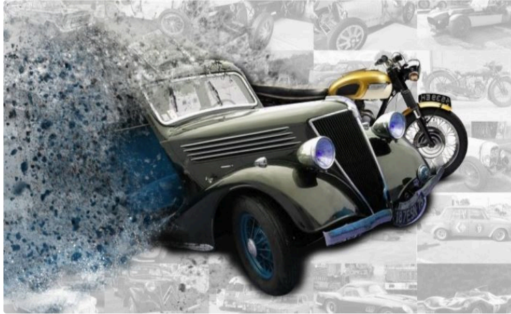
Une voiture à retaper, un lot plutôt original

Mis en jeu à l'occasion du premier Festival Auto Moto Rétro 32 organisé par la toute nouvelle association AMR 32