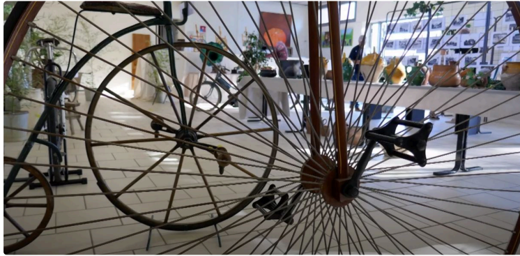
Un ouvrage doublé d'une exposition éphémère

Domage pour l'exposition, c'est trop tard, elle n'a duré qu'une seule journée, le 13 septembre dernier