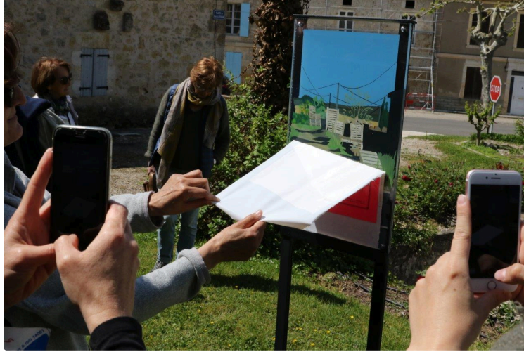
Enfin, on va pouvoir découvrir la 11e édition sur le terrain !

Cette fois, le visiteur va vraiment tracer sa route sur les Chemins d'Art en Armagnac