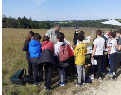
Le collège Gabriel Séailles sur le site de Cauderon