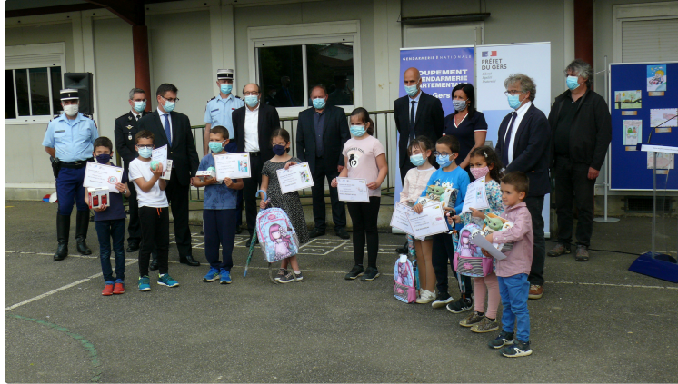
Concours de dessin de la sécurité routière : l'ALAE d'Auterrive rafle les premiers prix

Le Covid a eu raison de la cérémonie de la remise des prix du concours de dessin de la sécurité routière dans les salons de la préfecture. Le préfet du Gers, Xavier Brunetière, s'en explique : « Effectivement, nous devons recevoir à la préfecture les jeunes avec leurs parents pour un moment de convivialité mais en cette période nous ne pouvons pas nous réunir. Nous avons choisi l'école élémentaire d'Auterrive celle-ci ayant 9 lauréats sur 21 ».