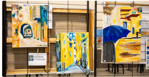
Tableaux de Dagmar Bünemann