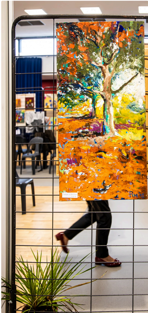
Tableau de Pim Harren