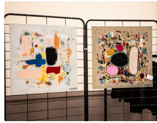
Tableaux de Kuteroff