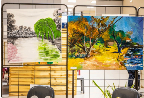
Tableaux de Pim Harren