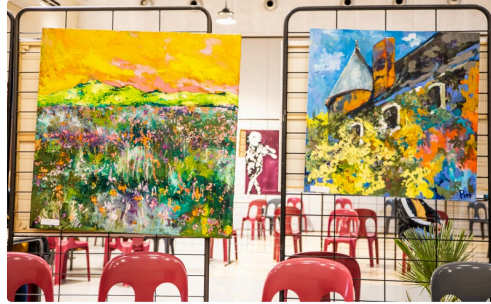
Tableaux de Pim Harren