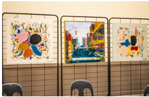
Tableaux de Kuteroff