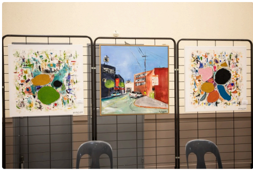
Tableaux de Kuteroff