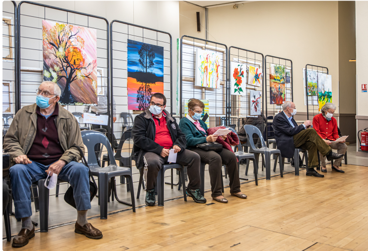
Encore de superbes tableaux au vaccinodrome de Nogaro (mis à jour)

Notamment de Kuteroff, Pim Harren et Dagmar Bünemann