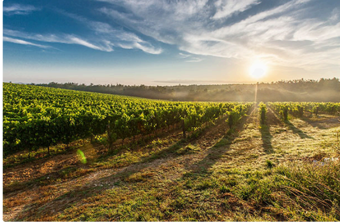
Quand la pandémie du Phylloxera détruisait toute la vigne française...

Le vignoble récemment victime du gel et la pandémie actuelle remettent en mémoire une autre pandémie, celle du Phylloxera qui en 30 ans allait détruire au XIXème siècle quasiment toutes les vignes françaises.