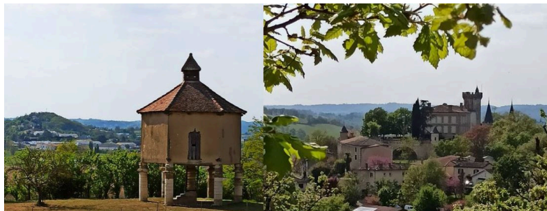
Montegut : un pigeonnier avec vue sur la colline en face et un château qu'on reconnaît de loin.