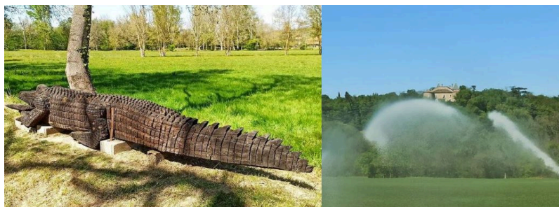
Auterive : sur le sentier de randonnée des berges du Gers, au niveau de la cascade, découvrez des sculptures en bois très variées, mais pas toutes aussi exotiques que ce crocodile. Pour y accéder, sur la place du village, prendre la route de Boucagnères.