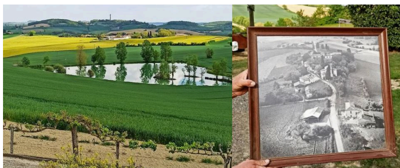
Peyrusse-Massas : une vue à couper le souffle et quels reflets dans l'eau !