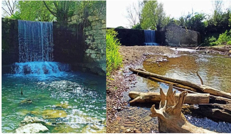
Un safari gersois : 18 villages visités en 16 jours

Ou comment voyager tout en respectant les règles établies : pas plus de 10 km autour de chez soi !